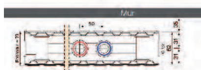
Type V Epaisseur 70 mm

Pression de service : 6 bars Température : 110°C max Fluide : Eau